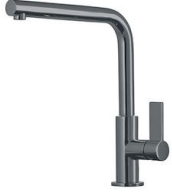
龙头 Omega Gun Metal 8497 856