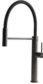
龙头 Skin Gun Metal 8424 856