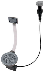
自动下水器 枪黑色 - PG 8407 110