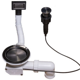
自动下水器 枪黑色 Space - PO 8407 120